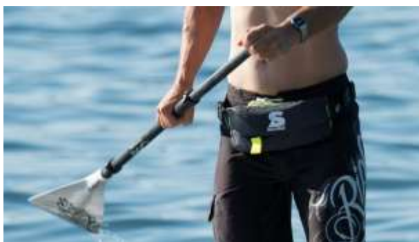
Gilet auto gonflant