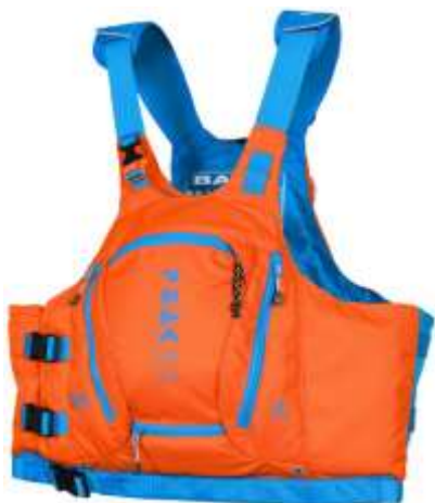
Gilet qui intègre une poche à eau ou petit sac